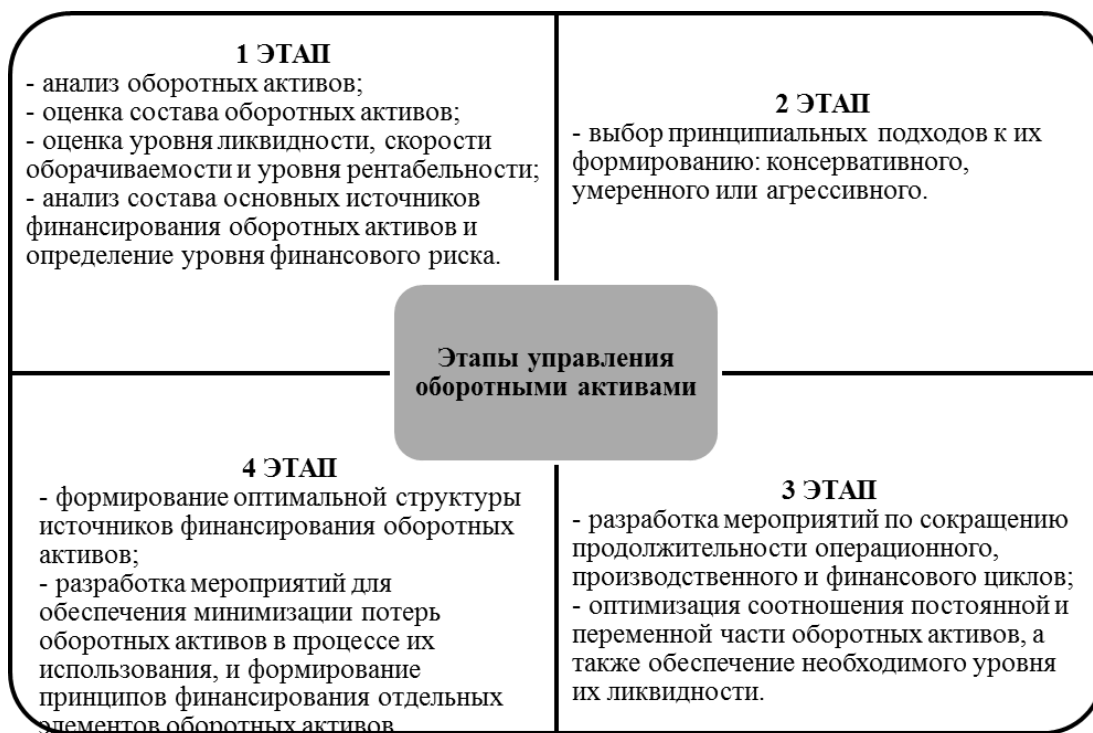
Рисунок 3. Этапы процесса управления оборотными активами предприятия

Политика управления оборотным активами разрабатывается поэтапно (рис. 4)