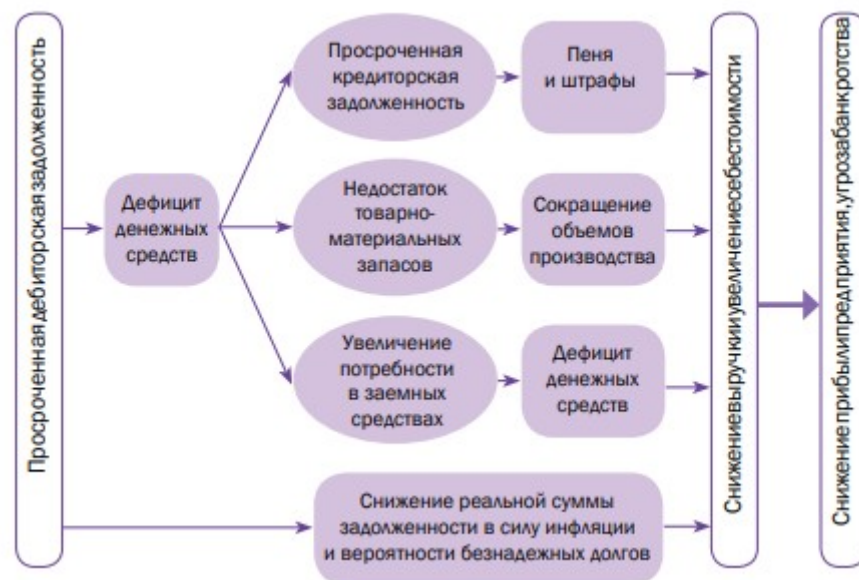
Рисунок 6 – Последствия реализации риска дебиторской задолженности коммерческого предприятия

Последствия реализации риска дебиторской задолженности наглядно представлены на рис. 6