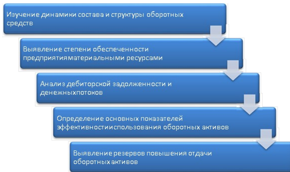
Рисунок 5 – Задачи анализа состояния и использования оборотных активов

Эффективность применения оборотных активов в деятельности компании зависит от некоторых факторов: