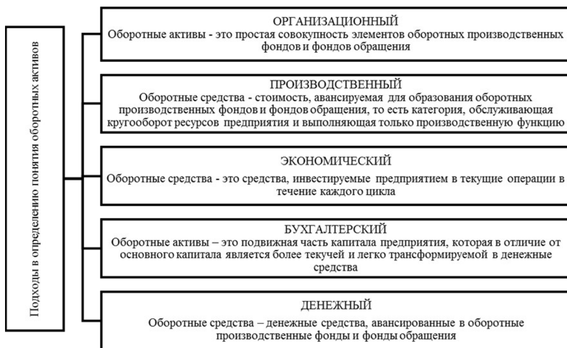
Рисунок 1 – Подходы к определению понятия «оборотные активы» предприятия

Выполненный литературный обзор позволяет обобщить точки зрения ученых экономистов в две большие группы: «вещный» и «монетарный» подходы. Согласно «вещному» подходу оборотные активы рассматриваются, как материальные ценности; недостаток этого подхода состоит в том, что для преобразования материальных ценностей в готовую продукцию необходимо участие дополнительных факторов производства, в частности труда; именно в процессе воздействия труда на материальные ценности и создается новая стоимость продукта. Таким образом, оборотные активы формально не являются материальными ценностями. В этом проявляется ограниченность «вещного» подхода.